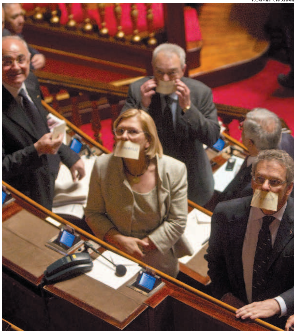
Un momento della protesta nell'aula del Senato