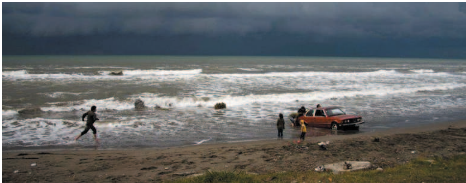
Ombre e misteri Una scena da «About Elly»