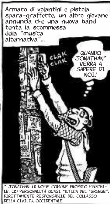
* JONATHAN: (1) NOME COMUNE PROPRIO MASCHILE; (2) PERSONALITÀ QUASI MITICA DEL "GRUNGE", DIRETTAMENTE RESPONSABILE DEL COLLASSO DELLA CIVILTÀ OCCIDENTALE.