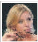
CONCITA DE GREGORIO Direttore cdegregorio@unita.it http://concita.blog.unita.it