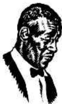
EDDIE "SON" HOUSE

COMMY JOHNSON, SON HOUSE, HOWLIN' WOLFE ALTRI GRANDI CANTANTI DI BLUES VENIVANO AD ASCOLTARE E A IMPARARE DA PATTON. ANCHE ALCUNI DI LORO DIVENTARONO DELLE LEGGENDE.