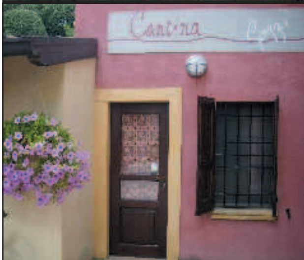
In alto: lungo la A4, nei pressi di Desenzano, echi della protesta contro le quote latte. A sinistra: la cantina di Cesare Gozzi a Monzambano. A destra: la lapide dedicata a Ippolito Nievo nella sua casa di Rodigo