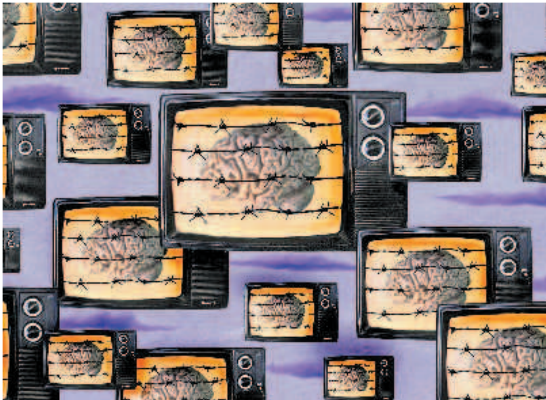
Illustrazione di Pierpaolo Tarea