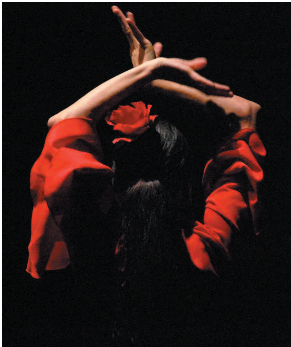
Ritmo e poesia Una ballerina di flamenco

Un momento chiave per la sua vita musicale fu l'incontro con Manuel de Falla, avvenuto nel 1920. Più grande di lui di oltre vent'anni, Falla per Lorca fu un faro. Fu il Concurso del Cante Jondo, organizzato insieme a Falla nel 1922, a sancire indissolubilmente il legame tra la poesia di García Lorca e l'immaginario del cante jondo.