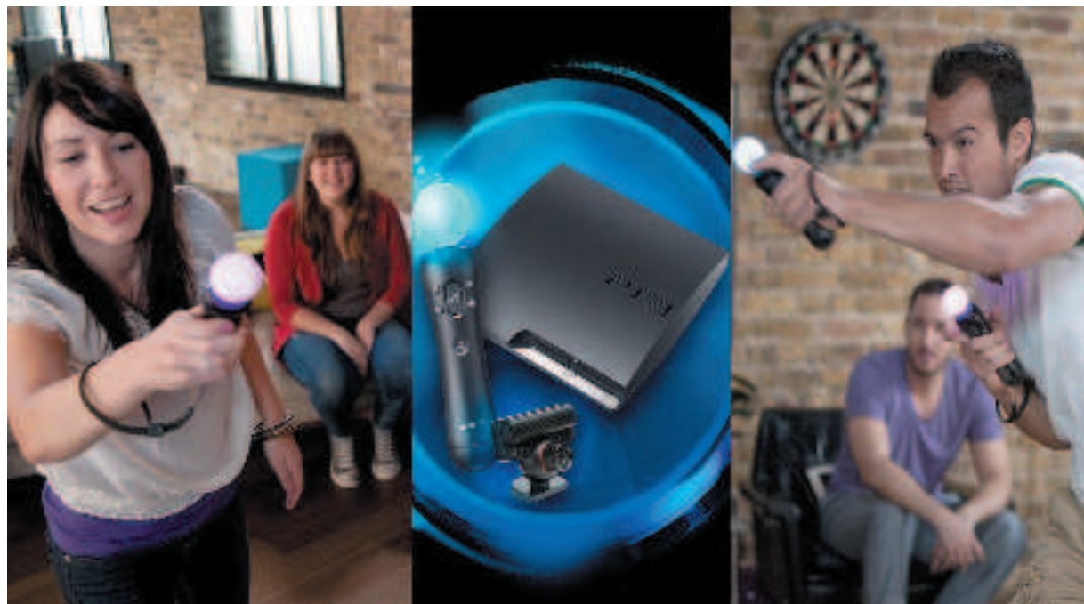
Il controller PS Move cambia l'esperienza di gioco con la PlayStation 3 rendendola più intuitiva e coinvolgente

A che cosa serva il controller è presto detto. Siamo in presenza di