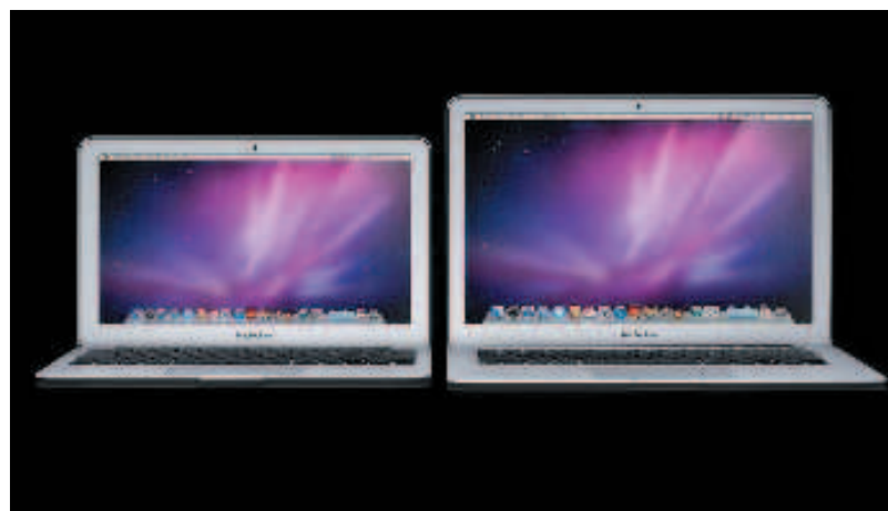
I nuovi MacBook Air sono disponibili in due versioni con schermi da 11 e 13 pollici