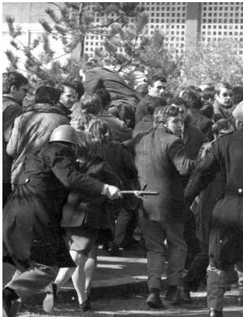
1 marzo 1968: gli scontri di Valle Giulia, a Roma, tra studenti e polizia

La poesia di Pasolini sugli incidenti di Valle Giulia denunciava l'italica tendenza al fratricidio. Invece fu letta come aggressione ai poliziotti-proletari