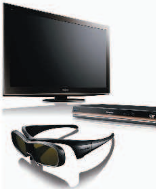
La cover dell'edizione Blu-ray 3D di Avatar; a destra, la catena hardware Panasonic per la visione tridimensionale: tv, occhiali e lettore