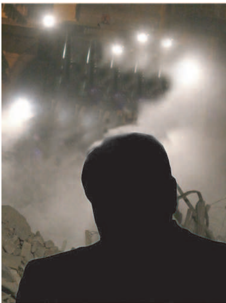
Colpi di coda Berlusconi disposto a tutto prima di lasciare

Ore di tensione sui tempi della crisi. Monito del Colle: «Prima l'approvazione definitiva della Finanziaria, poi la crisi». Il Pd pronto alla «vigilanza democratica» sui rischi di colpi di coda del Caimano.