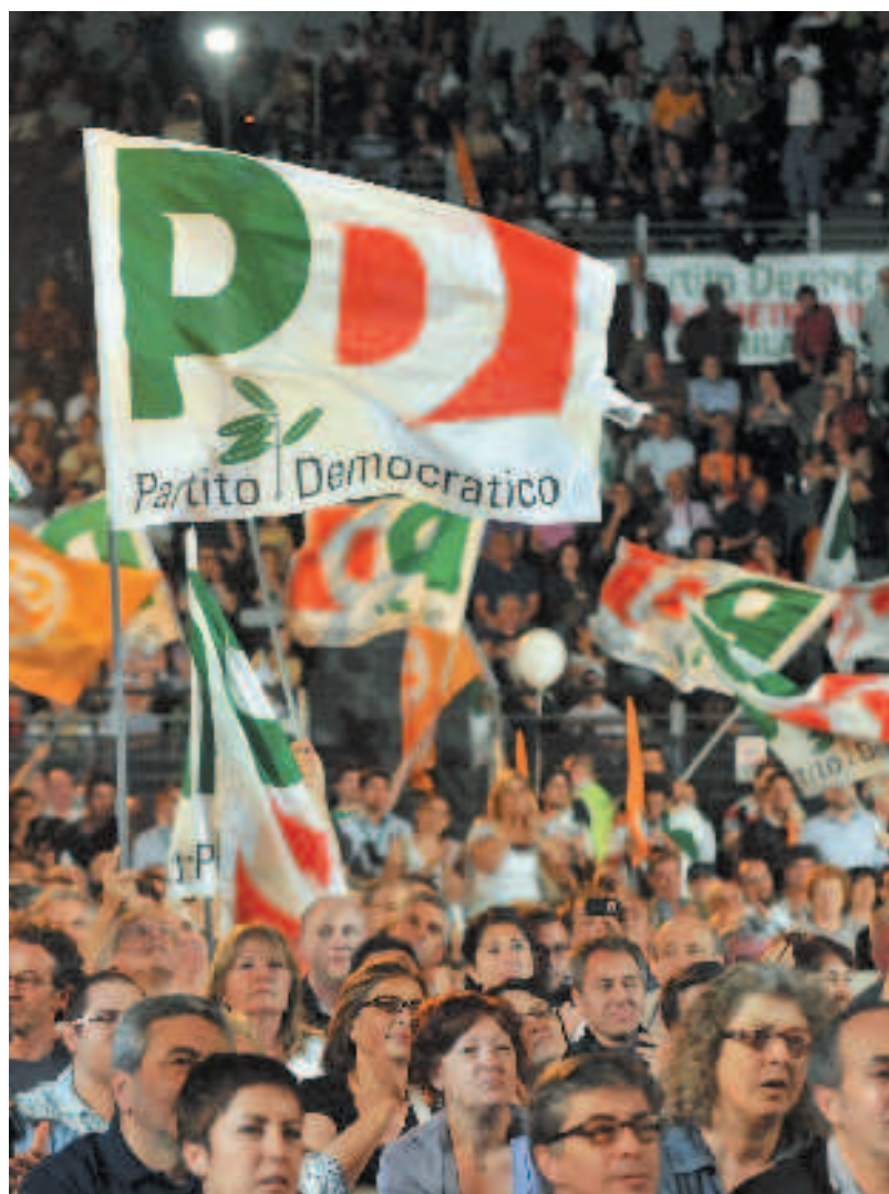
Sostenitori del Partito Democratico durante una manifestazione

Attorno al Pd si raccolgono due gruppi di protesta: gli astenuti per principio e gli elettori insoddisfatti Ai secondi dico: i dirigenti sono lo specchio di noi tutti