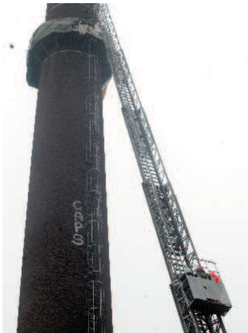
La torre della ex Carlo Erba a Milano: gli ultimi immigrati, scesi ieri, erano lì dal 5 novembre

Sono scesi dopo un mese ma la protesta degli immigrati, a Milano come a Brescia, non è finita Perché riguarda una nuova questione sociale