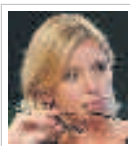
CONCITA DE GREGORIO Direttore cdegregorio@unita.it http://concita.blog.unita.it