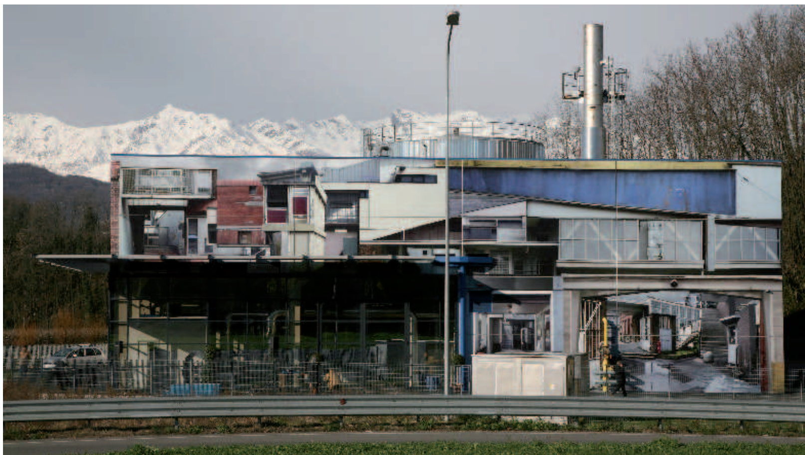
Botto e Bruno «This is the way, step inside», installazione permanente all'impianto di teleriscaldamento di Banchette

→ Botto&Bruno Un impianto industriale trasformato in «opera» dalla coppia di artisti torinesi