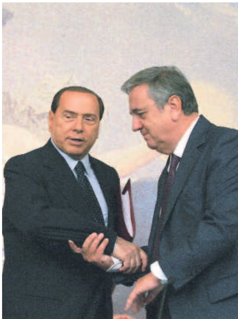
La circolare contro i registri comunali dei biotestamenti porta la firma di Sacconi

Dopo ventuno mesi il ddl sul biotestamento verrà sottoposto al voto della Camera. Intanto il governo ha potuto agire per via autoritaria