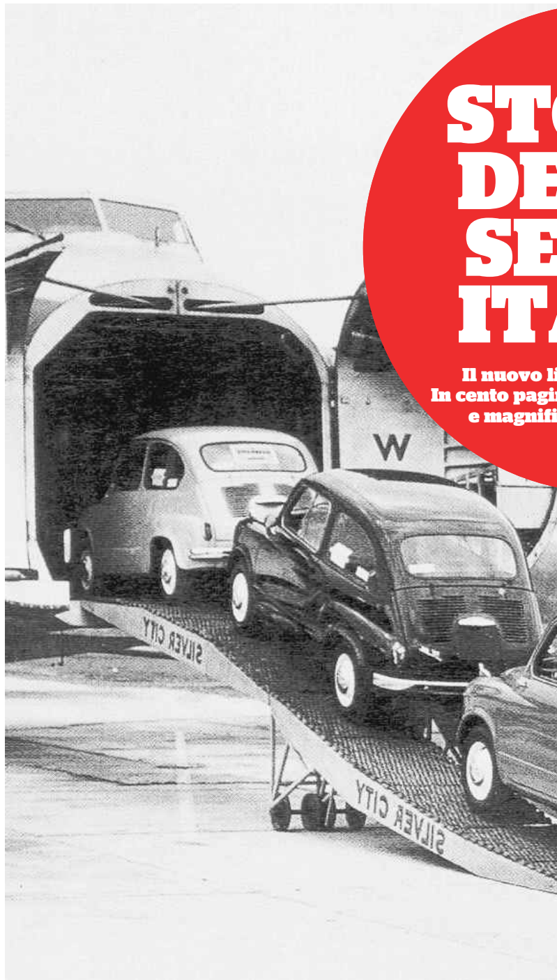
Anni Sessanta Un aereo carica delle Cinquecento

E un libro insieme laterale e importante, questo di Marco Lodoli: laterale perché ha la lunghezza dimessa del racconto lungo (un perfetto calviniano «centopagine») e perché ci consegna una storia fiorita non si arriva davvero a capire da quale misterioso anfratto dell'inconscio, importante perché questa trama, con il suo intreccio e il suo stile, illumina di una luce strana, tremenda, la nostra storia con la maiuscola, la nostra storia italiana. In questo centocinquantesimo, Italia per il narratore Lodoli è una serva che, come succedeva a certe orfane di un tempo, porta questo nome, allevata in un Istituto dove si «impara ad accettare», a diventare serve, appunto, cioè semplici funzioni di famiglie altrui, ma fino in fondo, esseri capaci di sentire, dei muri delle case non proprie, suoni e ritmo. Italia arriva in casa Marziali ancora minore, decisa a starci un anno, ma ci resterà un ventennio, finché la famiglia non si sarà dissolta. Quel nome così romano alla famiglia sta bene, perché il capofami-