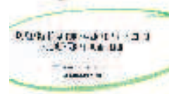
La richiesta della procura