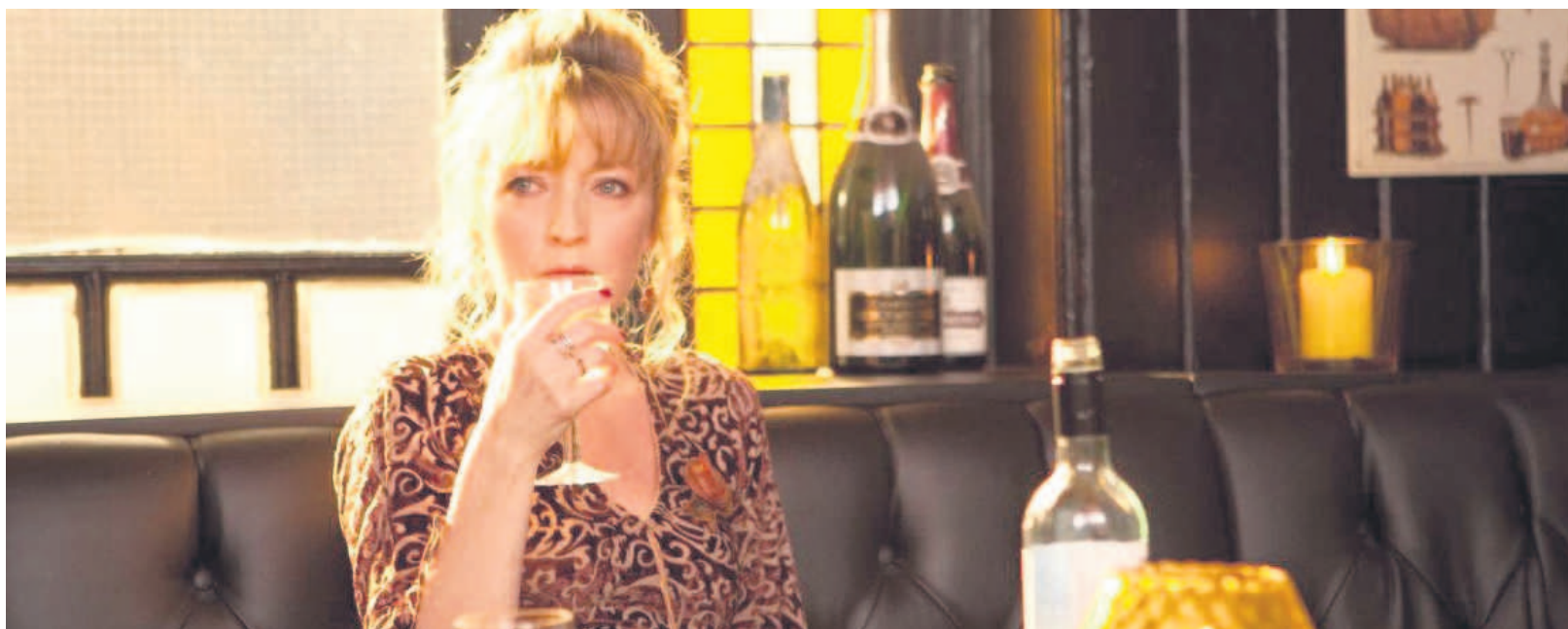
Verità & segreti Ruth Sheen in una scena di «Another Year» di Mike Leigh