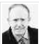
PINO ARLACCHI Eurodeputato del Pd