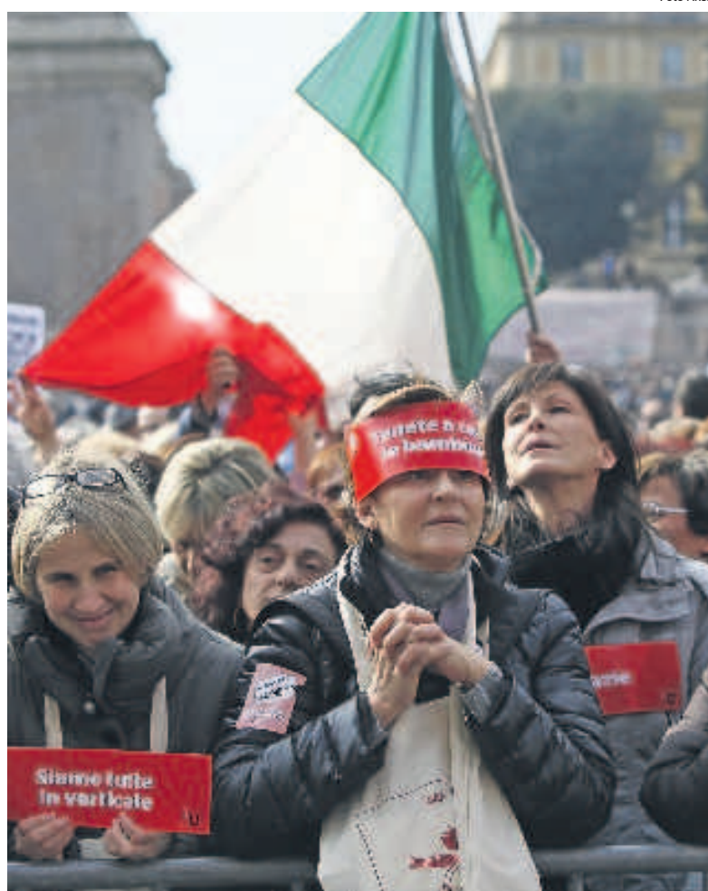
Un momento della manifestazione «Se non ora quando?»

12 MARZO Una giornata per la Costituzione