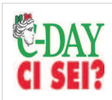
Il simbolo della manifestazione del 12

Una giornata per la Costituzione, il 12 marzo tutti in piazza. Silvio Berlusconi è indagato per concussione e prostituzione minorile. Sono reati che dovrebbero indurre chiunque a voler dimostrare la propria innocenza in tribunale. Il presidente del Consiglio, di fronte ai suoi problemi giudiziari, vuol cambiare le leggi, la giustizia e perfino la Costituzione. Contro questo uso spudorato del potere il movimento per il 12 marzo ci saranno manifestazioni in più città. Titolo della giornata: «A difesa della Costituzione» ( http://www.adifesa-dellacostituzione.it oppure sul sito della giornata stessa c-day). Per difendere quindi l'impalcatura della