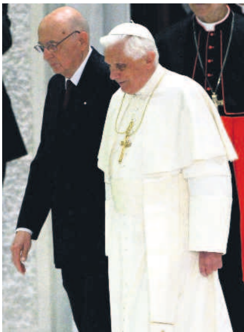
Il Papa e il Presidente Benedetto XVI e Giorgio Napolitano

Napolitano ha annunciato che il Papa si unirà alle celebrazioni per i 150 anni. È un messaggio importante rivolto a tutti i cattolici italiani