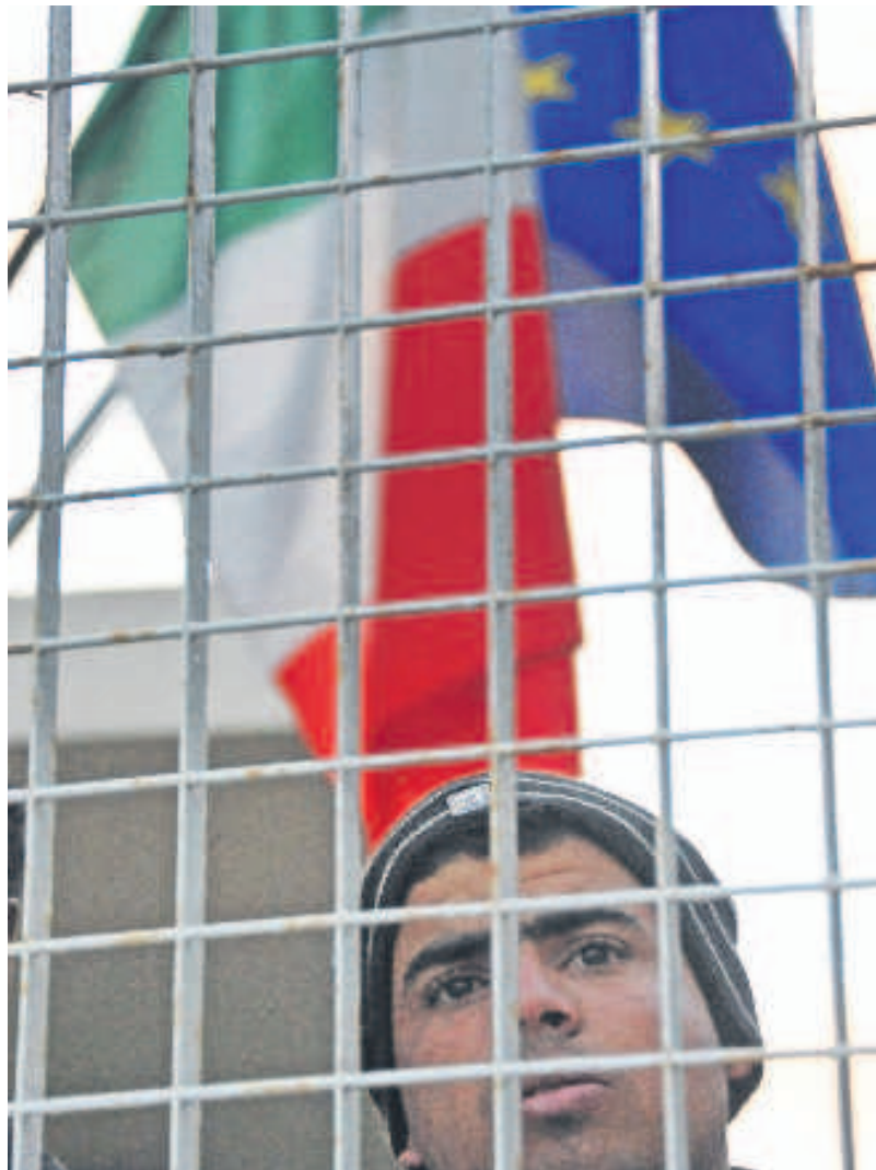
Il centro di accoglienza di Lampedusa