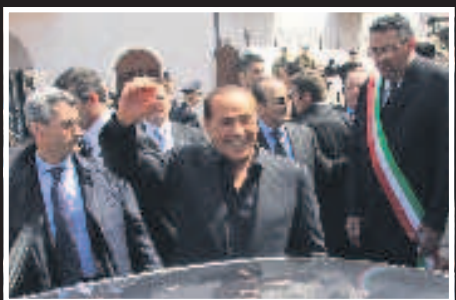
Il premier «laqualunque» a Lampedusa