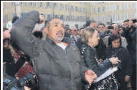
Montecitorio Prescrizione breve Cittadini indignati