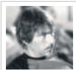
Alessandro Capriccioli Metilparaben