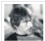
Alessandro Capriccioli Metilparaben

L'ultimo tragico e comico paradosso tricolore. Solo in Italia si può pensare di celebrare l'Unità nazionale mettendo insieme due che si detestano a tal punto. teleabissi.blog.unita.it