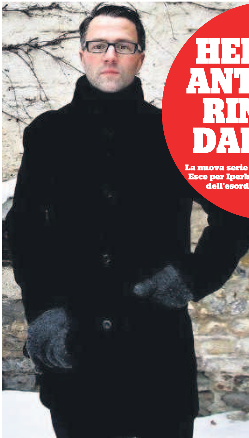
Insinuante Il romanziere norvegese Thomas Enger

Una talentuosa e provocante studentessa di cinema fustigata e lapidata in modo che evoca i precetti della Sharia. Il fidanzato musulmano messo sotto torchio dalla polizia. Un gruppo di giovani amici stregati, ammirati, ingelositi, addolorati. Ognuno incapace di mettere a fuoco la ragazza di cui ha conosciuto solo un lato, come in un prisma incomponibile. Una sceneggiatura urticante per un cortometraggio che somiglia troppo alla realtà. Un gioco di specchi della mente dove le fragilità umane si innestano in un tessuto urbano smagliato da cri-