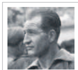
Massimo Franchi Bartali Storie di testardi che fanno incazzare

C'è ancora il ballottaggio, è presto per brindare. In Sardegna c'è di che essere felici: 98% di no al nucleare. E allora brindo ai tostissimi sardi con il tostissimo Cannonau. etlicamente.blog.unita.it