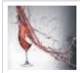
Fiorenzo Sartore Etlicamente Wineblog trasversale

Negli aeroporti italiani sono sparite le bottigliette di acqua da mezzo litro. Per portarle in aereo si può comprarle solo nei bar interni e da alcuni mesi se ne trovano solo da 75 cl. pensierini.blog.unita.it