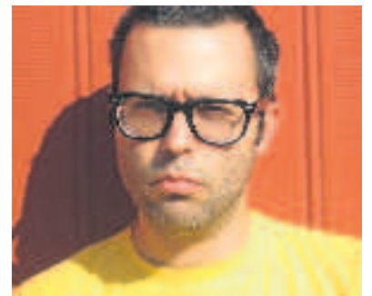
FRANCESCO DI GESÙ DETTO FRANKIE

Il maestro delle cerimonie della scena rap italiana