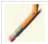
Mila Spicola La ricreazione non aspetta

La liquirizia mi disturba. Ti lascia quel nero... In tanti ultimamente sono dalla mia parte. Tutti si stanno rendendo conto che va eliminata dalla nostra vita. La Lega per prima uomomordecane.blog.unita.it