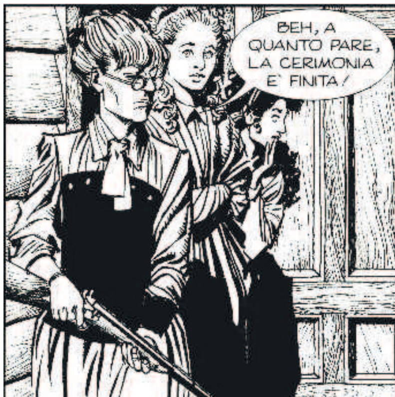
Tex e Emma Particolare di una tavola dell'albo «Verso l'Oregon»