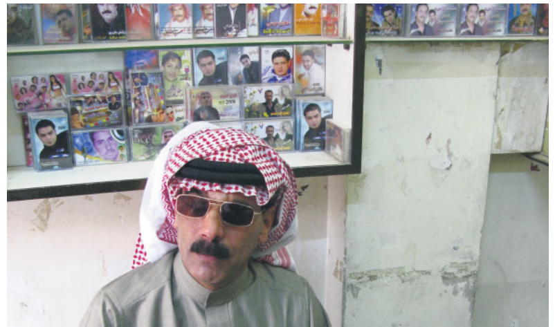
Il compositore siriano Omar Souleyman

voli disillusioni, eppure non rinunciò mai a combattere per le sue idee. Cosicché la parte più intrigante del libro è l'aver colto il nesso inscindibile tra arte, politica e vita di Bernstein: vuoi nelle sue scelte come direttore e ancor più in quelle di compositore, dai musical e i balletti, dal carattere popolare, all'opera Candide , alla sacrilega Mass , fino alle composizioni sinfoniche più ambiziose. Facendo emergere non il direttore patinato delle copertine dei dischi, ma finalmente la figura di un musicista cosciente del proprio ruolo nella società. ●