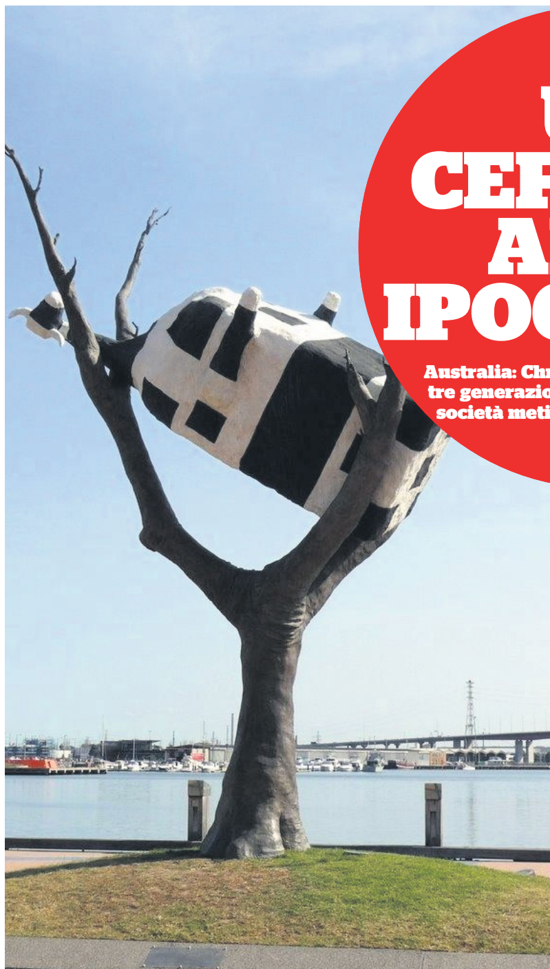
Australia In un parco di Melbourne le mucche stanno sugli alberi

S e cercate un libro per trascorrere gli ultimi scampoli dell'estate provate con Lo schiaffo . Di sicuro non vi lascerà indifferenti, starete per un bel po' in compagnia di personaggi credibilissimi, sedotti da dialoghi non banali e assisterete alla perfetta messa in scena della caduta del sogno multiculturale dell' Australian way of life . Siamo a Melbourne: belle case, belle coppie, bei figli, nonni contenti della loro riuscita sociale e di quella dei propri figli. Un'altra estate sta volgendo al termine e un'ennesima festa con tanto di barbecue sta per raccogliere a casa di Hector e Aisha, lui di origine greca lei di origine indiana, una numerosa comitiva del mosaico culturale proprio di quel paese continente. Li vedrete subito, come in un film di Altman, sono belli e quasi tutti sembrano ricchi e felici. C'è anche il piccolo Hugo, anni quattro che per le fisime new age della madre Rosie ancora prende il latte dal seno materno. A chi non è capitato di osservare in azione un bambino come Hugo, una di quelle pesti