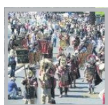
Il futuro dipende da noi

Io sono d'accordo sul fatto che stanno difendendo dei diritti e credo che la cosa sia difficile da capire perché non è facile scindere il "diritto dal denaro".