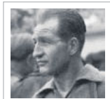
Massimo Franchi Bartali Storie di testardi