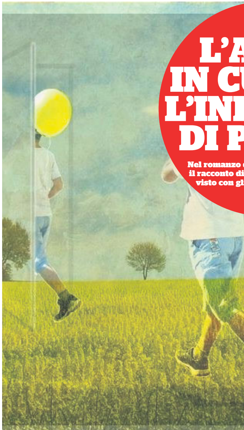
Un'opera di Norman Rockwell

La narrazione segue passo passo la crisi matrimoniale dei genitori, tra loro sempre più distanti. Capiamo che è soprattutto la madre a essere sempre insoddisfatta e insofferente. Lo scrittore è molto bravo nel rendere la sofferenza psicologica del bambino di fronte ai continui litigi tra papà e mamma, agli insulti e alle ripicche, ai piatti rotti, alle crisi di pianto. Il padre è un uomo buono e generoso, il suo lavoro consiste nel consegnare il pane a domicilio per conto del fornaio ai membri della piccola comunità. Tutti lo cono-