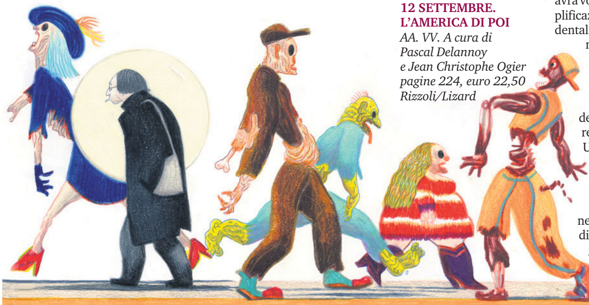
ZOMBIE I newyorkesi sconvolti disegnati da Lorenzo Mattotti. In alto, la copertina di Enki Bilal