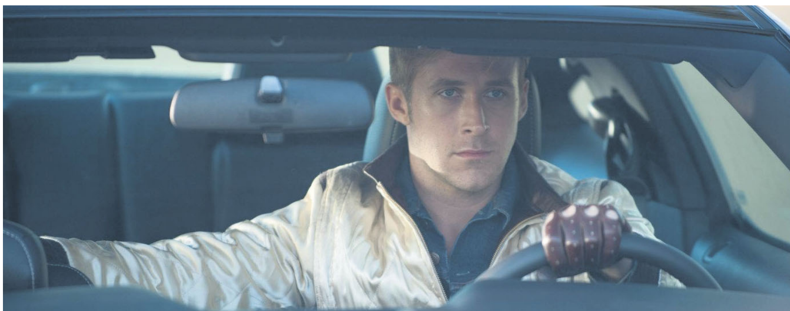
Guida pericolosa Ryan Gosling è il meccanico-pilota provetto di «Drive» diretto da Refn