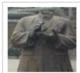
Ivan Franceschini Appunti Cinesi