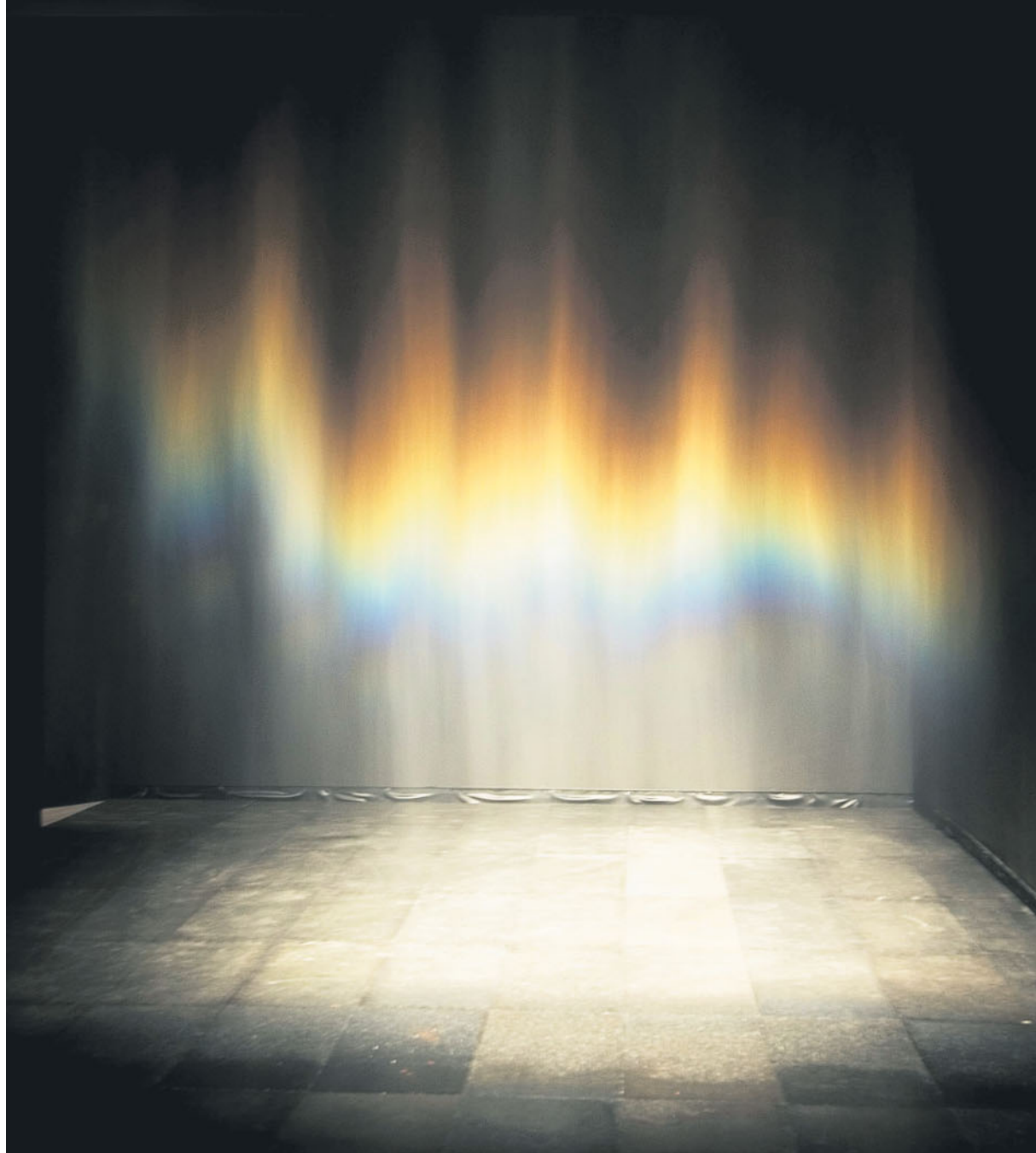
Olafur Eliasson «Beauty» (1993)

Neo-Contemporaneo Otto curatori tentano l'impossibile: scegliere duecento «pivotal artworks», ovvero opere di «importanza cardinale» dal 1986 fino a oggi. Ma in base a quale criterio avviene la scelta?