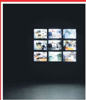
Boltanski «The Life of C. B.» (2010)