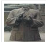
Ivan Franceschini Appunti Cinesi