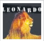
Leonardo Tondelli Leonardo

È appollaiato sull'angolo più alto della cornice dorata del quadro nel centro della bottega, è il suo piccolo occhio mobile l'unico indizio del trucco mimetico: non è un uccello... gocciaagoccia.blog.unita.it