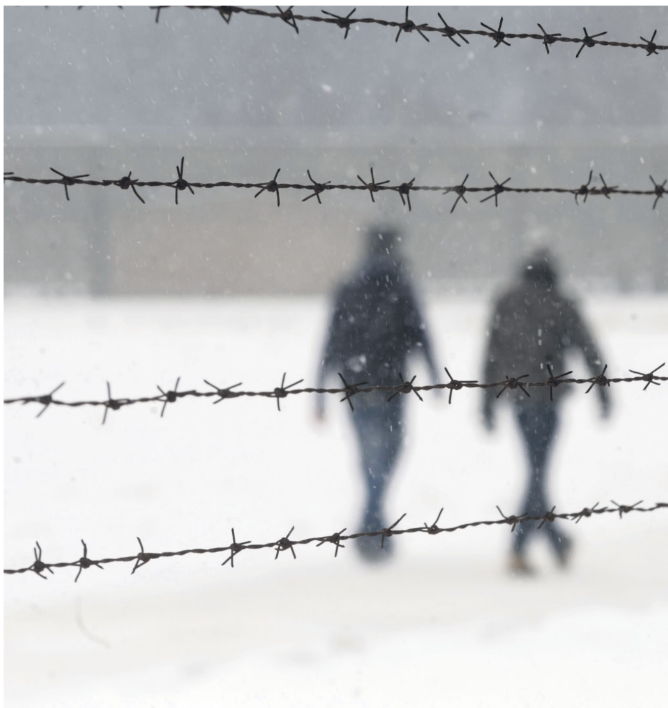
Oranienburg Dei passanti davanti al campo di concentramento di Sachsenhausen