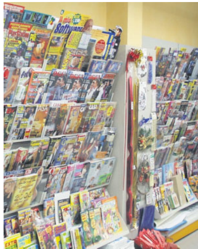
Per l'editoria la minaccia del taglio dei fondi

«L'informazione con l'apostrofo a sinistra». Un titolo intrigante per fare i conti con i problemi dell'editoria «schierata» nell'area del Partito democratico e ragionare anche sulla fase nuova che si è aperta con la caduta di Silvio Berlusconi. Si sono