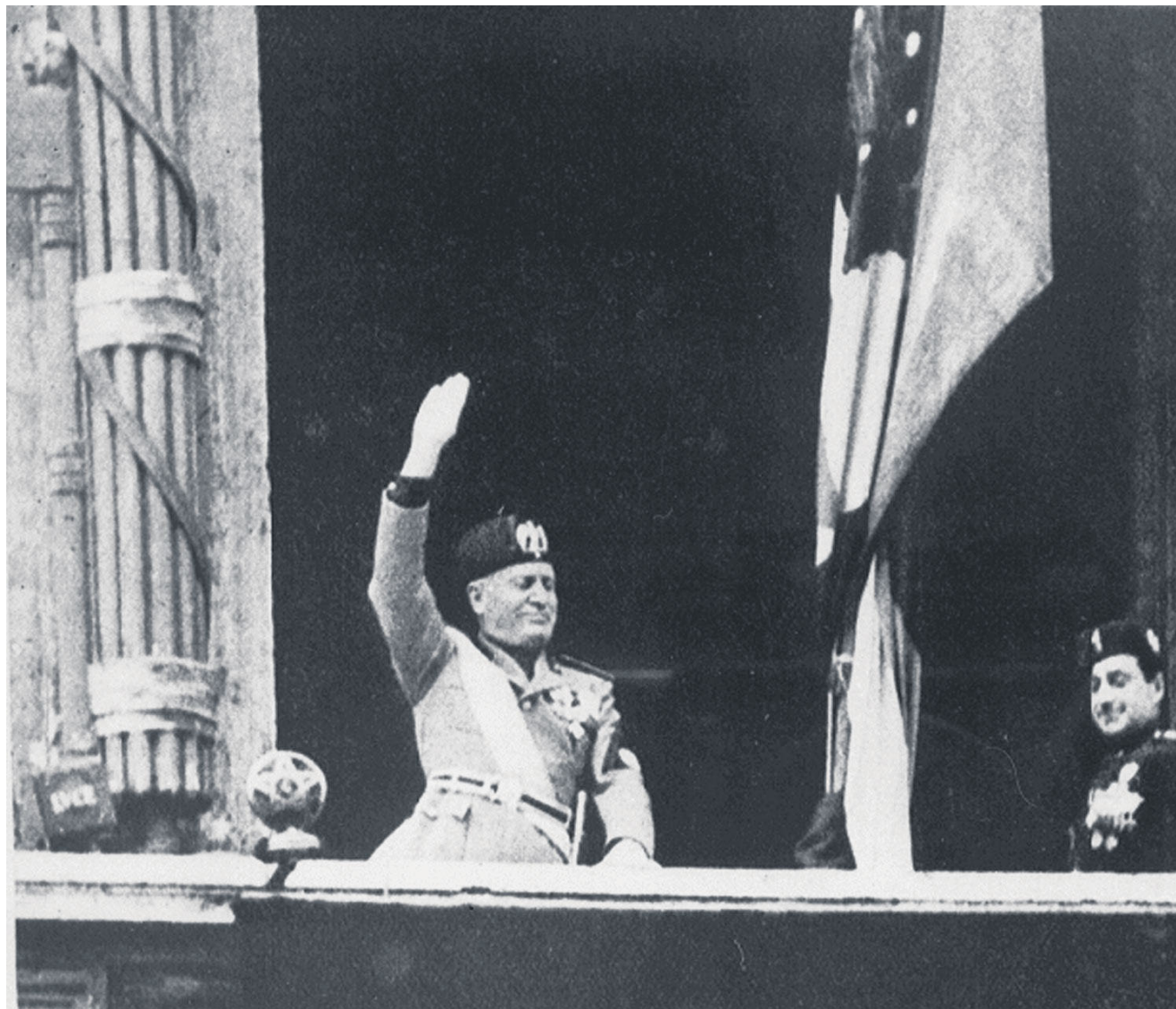
Una foto d'archivio di Benito Mussolini: da quel balcone di Palazzo Venezia dichiarò guerra alla Francia e al Regno Unito

«Dieci lezioni sull'Italia contemporanea. Da quando non eravamo ancora nazione...a quando facciamo fatica a rimanerle» di Mario Isnenghi (pagine 292, euro 18,50, Donzelli) è il racconto di 150 anni di storia del nostro paese, utile soprattutto ai più giovani. In questa pagina vi anticipiamo un brano dal capitolo «Bandiera rossa trionferà, il cristianesimo la libertà».