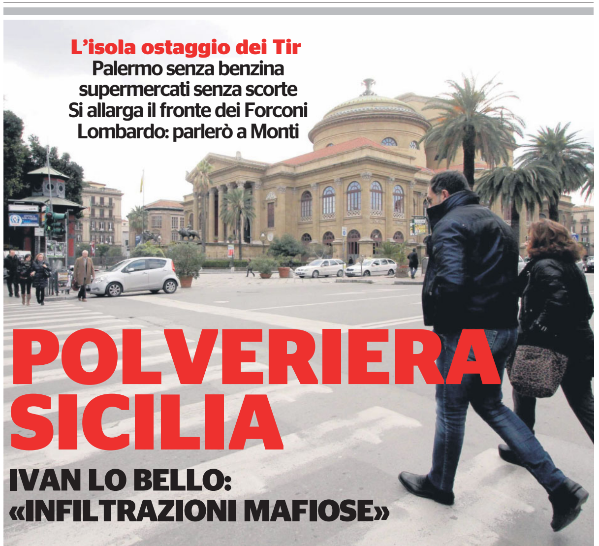
Il centro di Palermo strade deserte a causa della mancanza di carburante

L'isola ostaggio dei Tir Palermo senza benzina supermercati senza scorte Si allarga il fronte dei Forconi Lombardo: parlerò a Monti