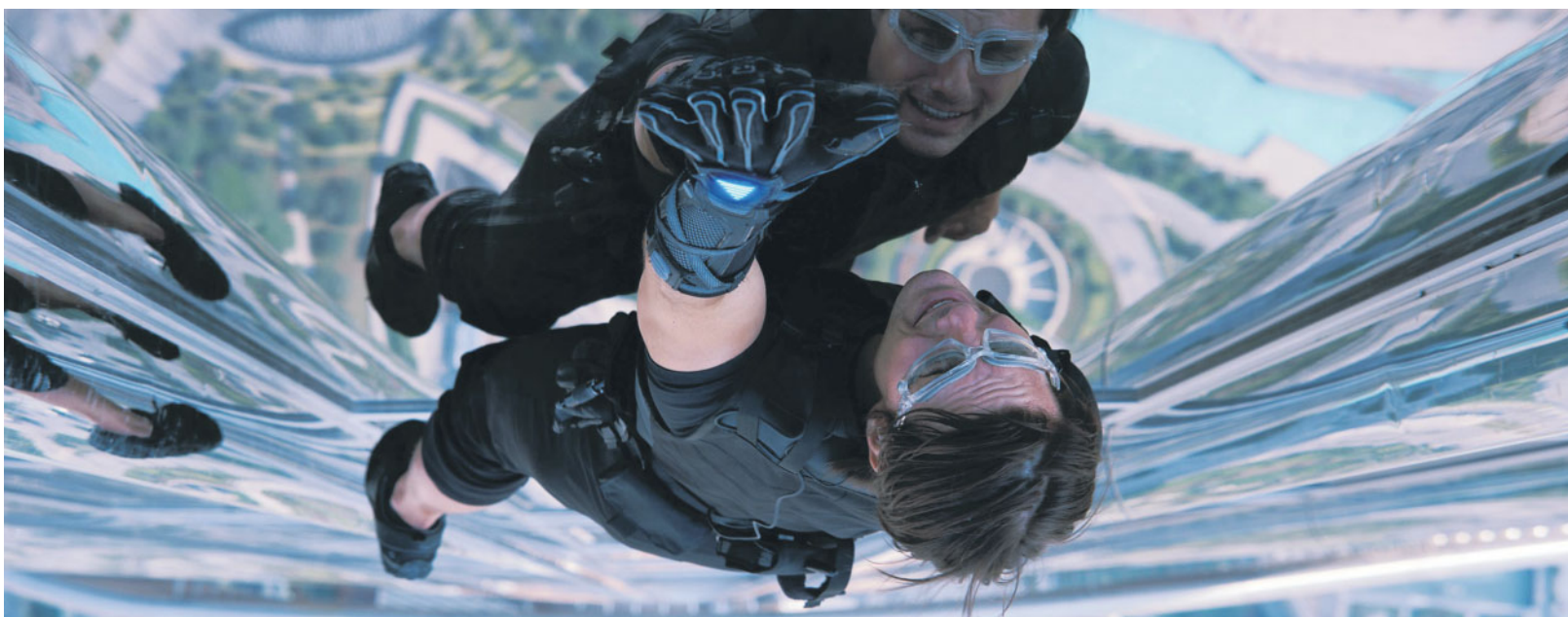
Visioni aeree Una vertiginosa scena dal quarto «Mission impossible»