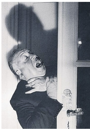
Alfred Hitchcock Declinò un Cbe nel '62 L'anno dopo diventò Sir

una gioventù da angry young men finiscono per cedere ai miti consigli della maturità e alle lusinghe di una cerimonia al cospetto della Sovrana e del côté curtense, come nel caso del drammaturgo David Hare. Altri non possono non vedervi un misto di ridicolo e anacronismo, come lo stesso Ballard, che rilasciò una sprezzante dichiarazione di rifiuto nel 2003: