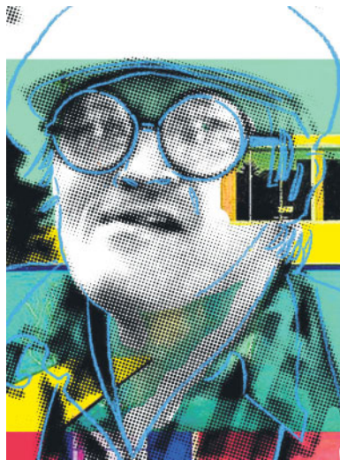
David Hockney Anche per l'artista due honours dopo il rifiuto

che aveva dato al proprio Paese. In questo caso, il rischio pagò: diventò Sir Alfred pochi mesi prima della morte, nel 1980. Oppure di Lucian Freud, che nel 1977 rifiutò lo stesso titolo per poi accettare i più prestigiosi Companionship of Honour (Co) nel 1983 e un Order of Merit (Om) nel 1993. Anche David Hockney, una cui enorme personale al momento dilaga alla Royal Academy, ha adottato con profitto una simile strategia: rifiuto della Knighthood nel 1990 per poi accettare Co e Om, quest'ultimo appena il mese scorso.