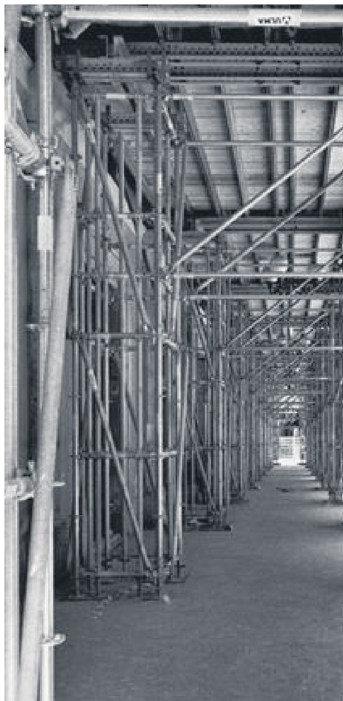
Corso Vittorio Emanuele II Da sempre punto di passaggio privilegiato per la città. Gli stessi portici ora colmi di silenzio